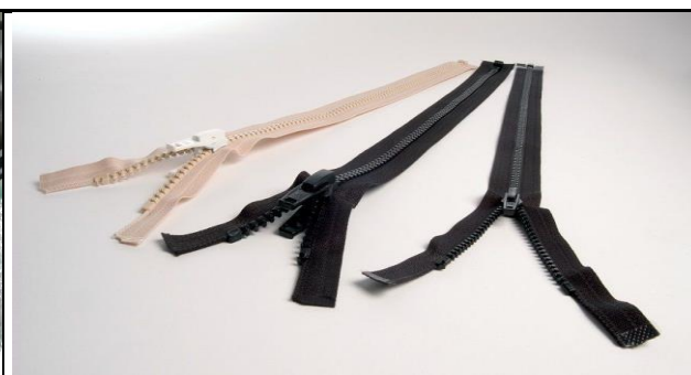
Fig. 2 - Cerniere