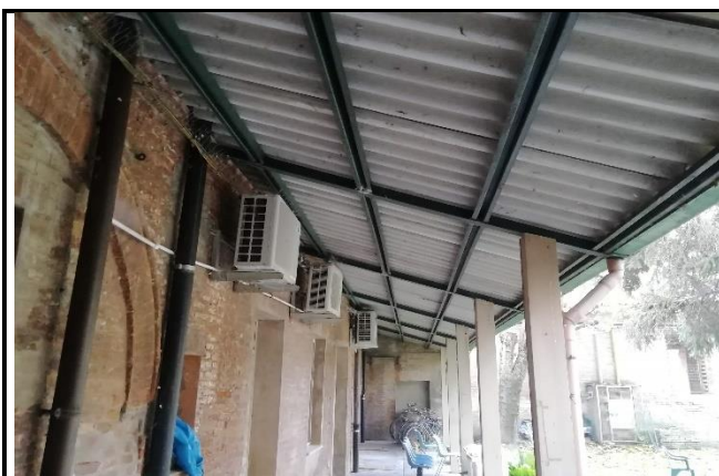
Fig. 1 – Tettoia

Per l'esecuzione delle sopra indicate attività si impiegherà un trabatello su ruote o scala a libro.