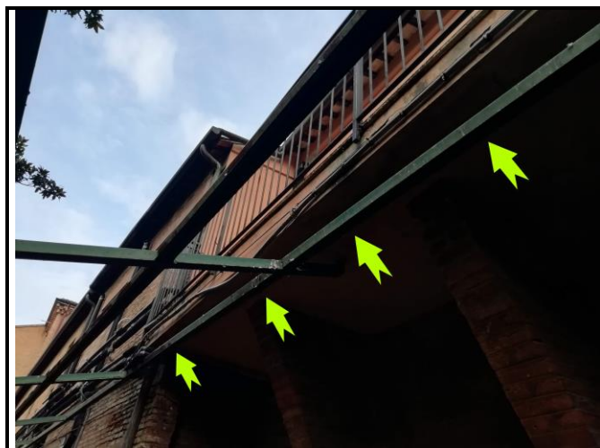
Fig. 5 – Putrella sotto balcone

Si provvederà al posizionamento di aghi a riccio in acciaio inox su base in policarbonato in corrispondenza della putrella posta sotto il balcone (Fig.5). Tali dispositivi verranno fissati mediante rivetti, o viti autopercoranti direttamente alla struttura metallica.