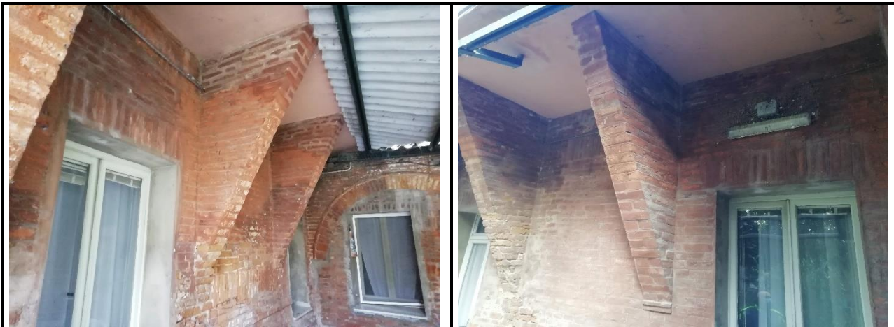
Fig. 3 – n.6 Elementi Architettonici

La rete andrà a proteggere i possibili punti di appoggio posti tra gli elementi architettonici sotto il balcone (Fig.3).