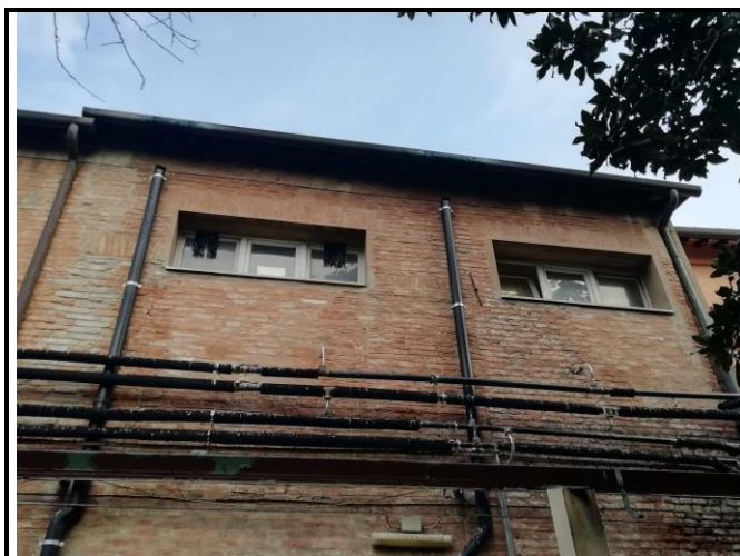
Fig. 4 – Finestre Lavanderia-Bagno

La rete andrà a proteggere il davanzale delle finestre stesse (Fig.4).