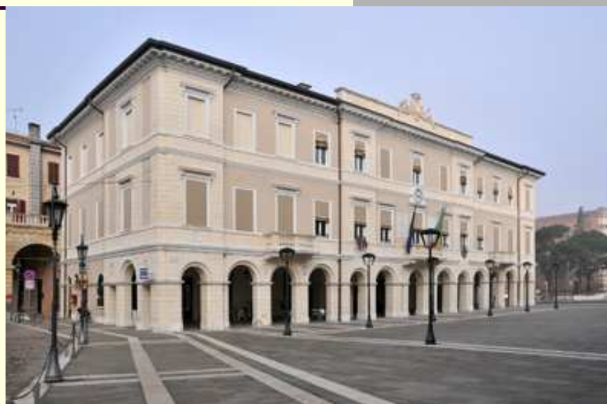
Portomaggiore, Piazza Umberto I

Il CaFè aprirà due volte al mese dal giorno 11 gennaio 2011, il martedì pomeriggio dalle 14.30 alle 17.30