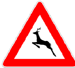
ANIMALI SELVATICI VAGANTI

Presegnala un tratto di strada con probabile attraversamento, anche improvviso, di animali selvatici (Codice della Strada); può essere integrato da un pannello recante una lunghezza, espressa in metri o chilometri, tra due frecce (estesa) che precisa la lunghezza del tratto di strada pericoloso.