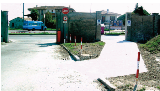
Nuovo accesso pedonale via Crocettola - Codigoro

Si sono conclusi nel mese di marzo i lavori al presidio socio-sanitario di Codigoro per realizzare il nuovo passaggio pedonale su Via Crocettola, adiacente all'uscita carrabile ed in prossimità del parcheggio.